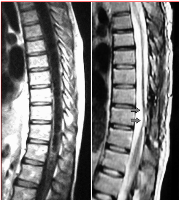
FIGURA 3. Risonanze magnetiche di siringa, prima dell'operazione (A) e durante il follow-up (B). Riduzione completa della siringa e ancoraggio (tethering) del midollo spinale (freccie) nella sede della cannulazione della siringa.

compresi gli interventi di shunt siringo-peritoneali e siringo-subaracnoidei (1, 4, 14, 18, 26). A nostro avviso, ciò dimostra a sufficienza l'efficacia superiore degli interventi di SPS. In effetti, noi crediamo che la sostanziale differenza nei gradienti di pressione che si verificano nelle tre aree coinvolte influisca sia sul tasso di svuotamento che sulla conservazione di shunt liberi da ostruzioni. Nello spazio sub-aracnoideo si rileva una pressione che è quasi paragonabile a quella dell'area intracavitaria, mentre nella cavità peritoneale, per non parlare della presenza dell'omento che aumenta l'incidenza di ostruzioni nel catetere, si rileva per la maggior parte del tempo una pressione maggiore rispetto a quella della siringa. Il verificarsi di una pressione inferiore controbilanciata dall'espansione del polmone avviene solo nell'area pleurica, creando in tal modo uno spazio virtuale. Il gioco fra queste forze opposte potrebbe rappresentare il gradiente ideale, o almeno quello più idoneo, per il drenaggio della siringa, nella quale un drenaggio eccessivo provoca insorgenza di gliosi e ostruzione del catetere, e un drenaggio insufficiente si traduce in espansione della siringa.